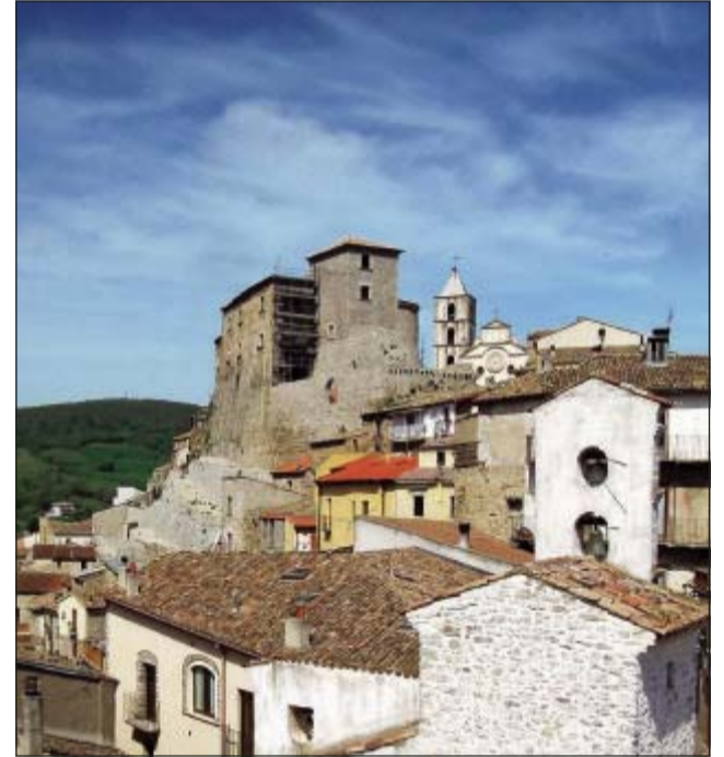
Uno scorcio del Comune di Cancellara con la vista sul castello