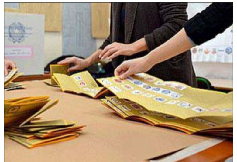
Un momento dello spoglio elettorale in uno dei comuni in cui ieri si è rinnovata l'amministrazione