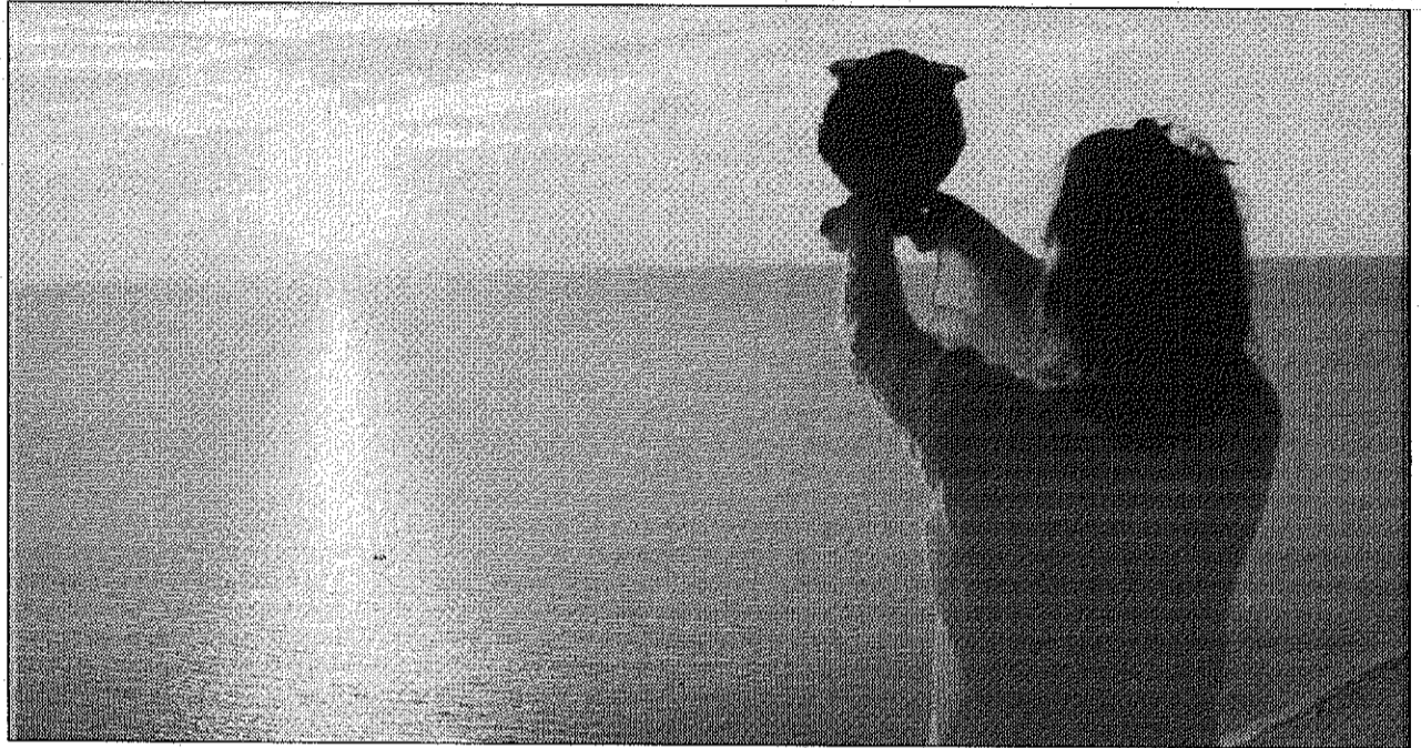
Un'urna cineraria sul mare: le ceneri, in questo caso, saranno disperse «in natura»