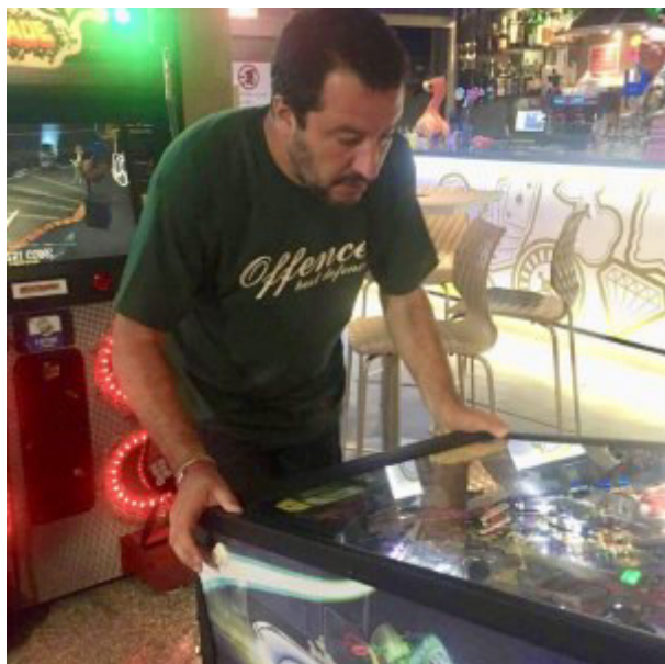
IL Ministro Salvini gioca a Flipper ( a dimostrazione della sua età mentale )

Una T-shirt venduta su un portale specializzato in gadget dei movimenti fascisti europei, con la scritta offence best defence (“offendere è la miglior difesa” ) .