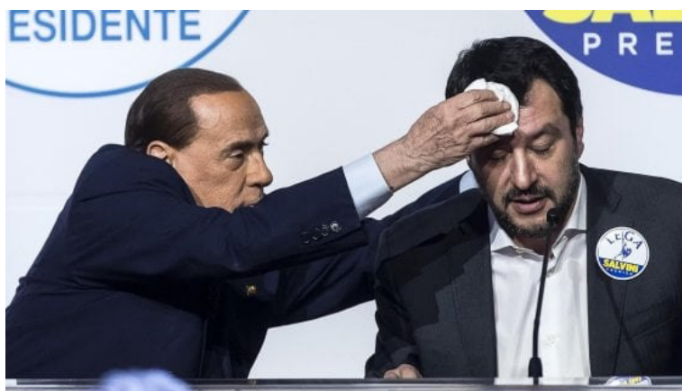
ed ha chi gli asciuga il sudore

Prima il giubbotto d'ordinanza di CasaPound Italia sfoggiato in Tribuna d'onore allo Stadio Olimpico, adesso la T-shirt di una linea ultra di estrema destra : " Offence best defence ".